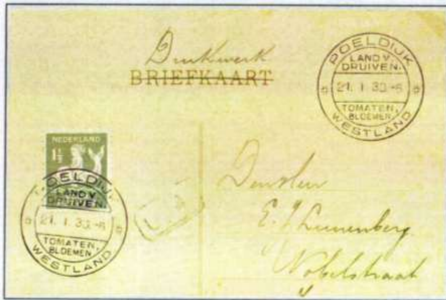
Bild 4: Werbestempel von Poeldijk - Land der Trauben, Tomaten und Blumen