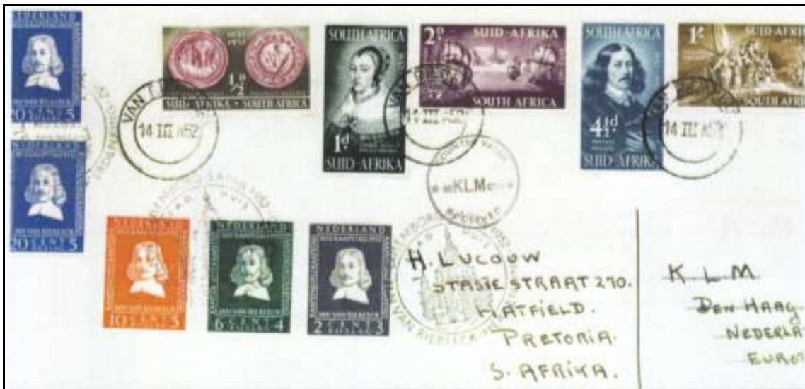
Bild 10: NVPH 578 bis 581 mit südafrikanischen Marken auf Brief mit Gefälligkeitsstempel

Jan van Riebeeck ist unter anderem der Begründer von Kapstadt. Die 1652 von ihm gegründete Niederlassung an strategisch günstig gelegenen Ort sollte die niederländischen Seefahrer auf ihrem Weg nach Ost-Indien mit frischem Obst und Gemüse versorgen. Auf diesem Weg fanden die ersten Traubenstöcke 1655 den Weg nach Südafrika – Wein wurde allerdings erst 1661 gerntet – Hottentotten hatten den Weinberg zwischenzeitlich niedergebrannt.