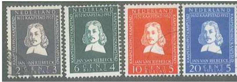
Bild 9: NVPH 578 bis 581 Jan van Riebeeck, ein Förderer des Weinbaus

Jan van Riebeeck ist unter anderem der Begründer von Kapstadt. Die 1652 von ihm gegründete Niederlassung an strategisch günstig gelegenen Ort sollte die niederländischen Seefahrer auf ihrem Weg nach Ost-Indien mit frischem Obst und Gemüse versorgen. Auf diesem Weg fanden die ersten Traubenstöcke 1655 den Weg nach Südafrika – Wein wurde allerdings erst 1661 gerntet – Hottentotten hatten den Weinberg zwischenzeitlich niedergebrannt.